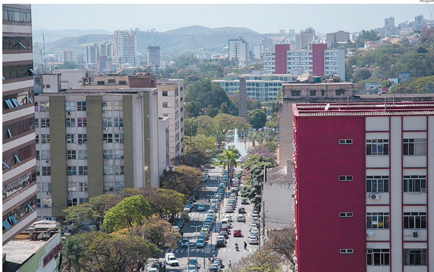
Comércio da construção civil, ferragens, madeiras, serralherias, pinturas, assim com o atacadista, entre outros, podem abrir de 10 às 18 horas, em Volta Redonda

Comércio pode abrir de 10 às 19 horas e aulas escolas nas redes municipal e privada ficam suspensas até o dia 4 de abril