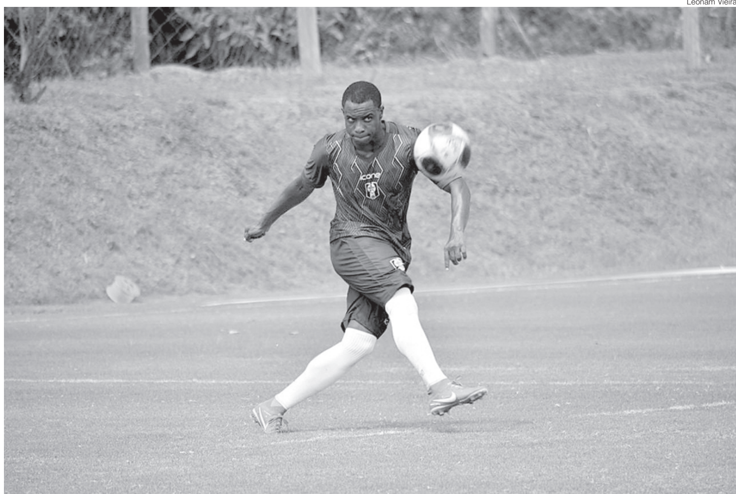
Projeto de formação de atletas é desenvolvido pelo Resende em parceria com o CT Pelé Academia