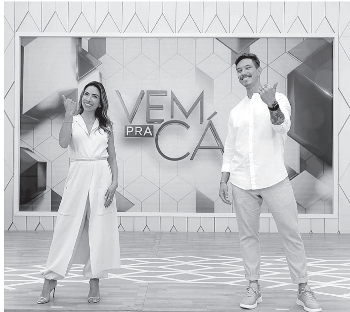
Patrícia Abravanel e Gabriel Cartolano, apresentadores do “Vem Pra Cá”