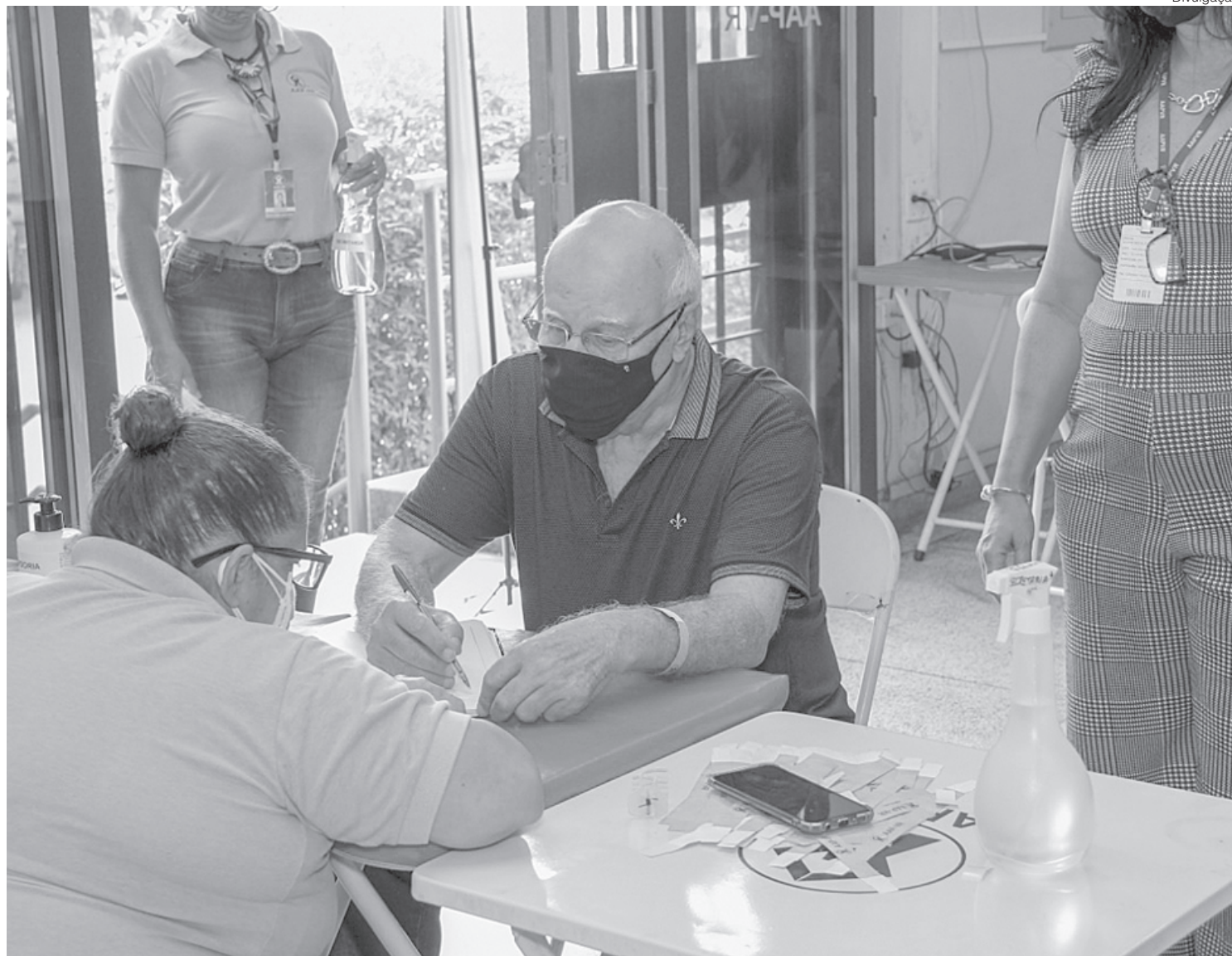
Presidente reeleito afirma que trabalho em equipe é importante para o crescimento da Associação