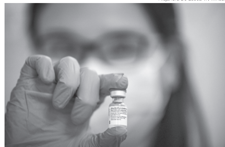
Empresas pretendem ampliar vacinação para menores de 12 anos até 2022

Inicialmente, a Pfizer e a BioNTech planejam avaliar a segurança de sua vacina de duas doses em