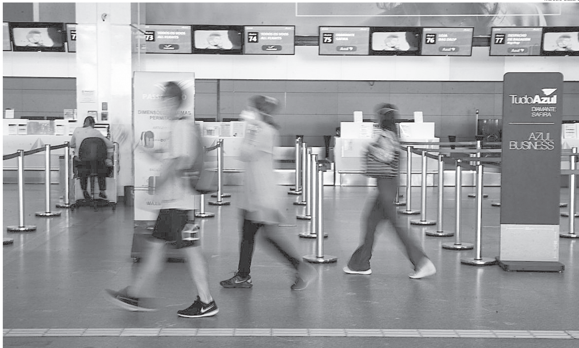
Resolução proíbe o uso de lenços, bandanas e máscaras de acrílico; face shield só pode ser usado por pessoas que estiverem com máscara por baixo

Entram em vigor nesta quinta-feira, dia 25, as novas regras que aumentam o rigor no uso de máscaras em aeroportos e a bordo de aviões. As alterações foram aprovadas pela Agência Nacional de Vigilância Sanitária (Anvisa) no dia 11 de março, e constam na Resolução da Diretoria Colegiada (RDC) nº 456, de 17 de dezembro de 2020.