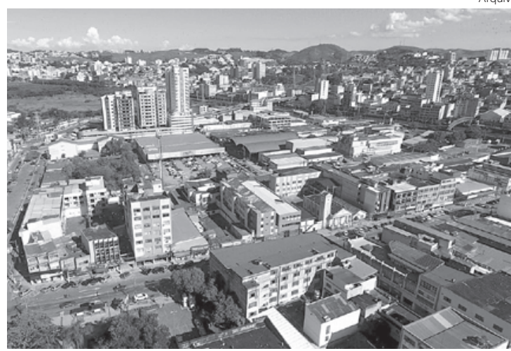
Decreto regulamenta atividades econômicas durante feriado especial de dez dias para combater Covid-19

As áreas de Saúde, Defesa Civil, Segurança e do Serviço Funerário, além de outras unidades cujas atividades não possam sofrer solução de continuidade prosseguem funcionando normalmente.