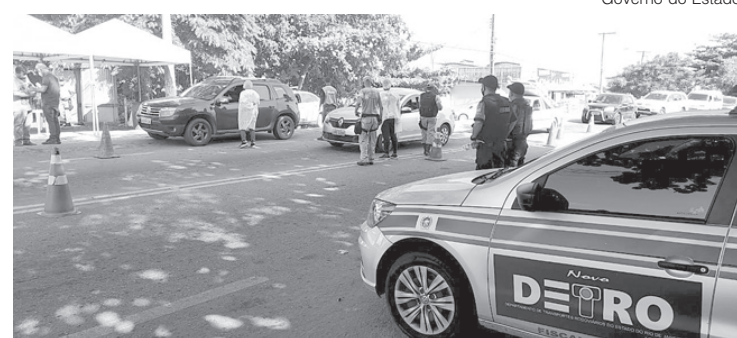
As operações seguem até o dia 01 de abril

Estão previstas ainda ações em vários pontos da capital, como: em frente ao Into (descida da Ponte Rio-Niterói), Santa Cruz, Trevo das Missões, Linha Amarela, Grota Funda, entre outros.