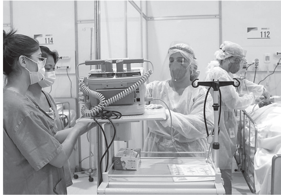
O total de leitos entre UTI e enfermaria alcançou na quarta-feira 858 pacientes